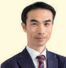
穴井りゅうじ社会保険労務士事務所 穴井 隆二 様