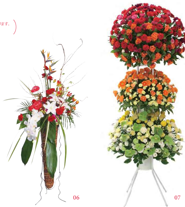
07 スタンド花 税別 ¥50,000 サイズ: 約 H230xW100cm