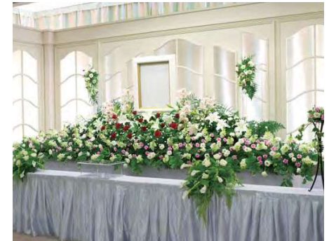
〈生花祭壇 洋花仕様〉