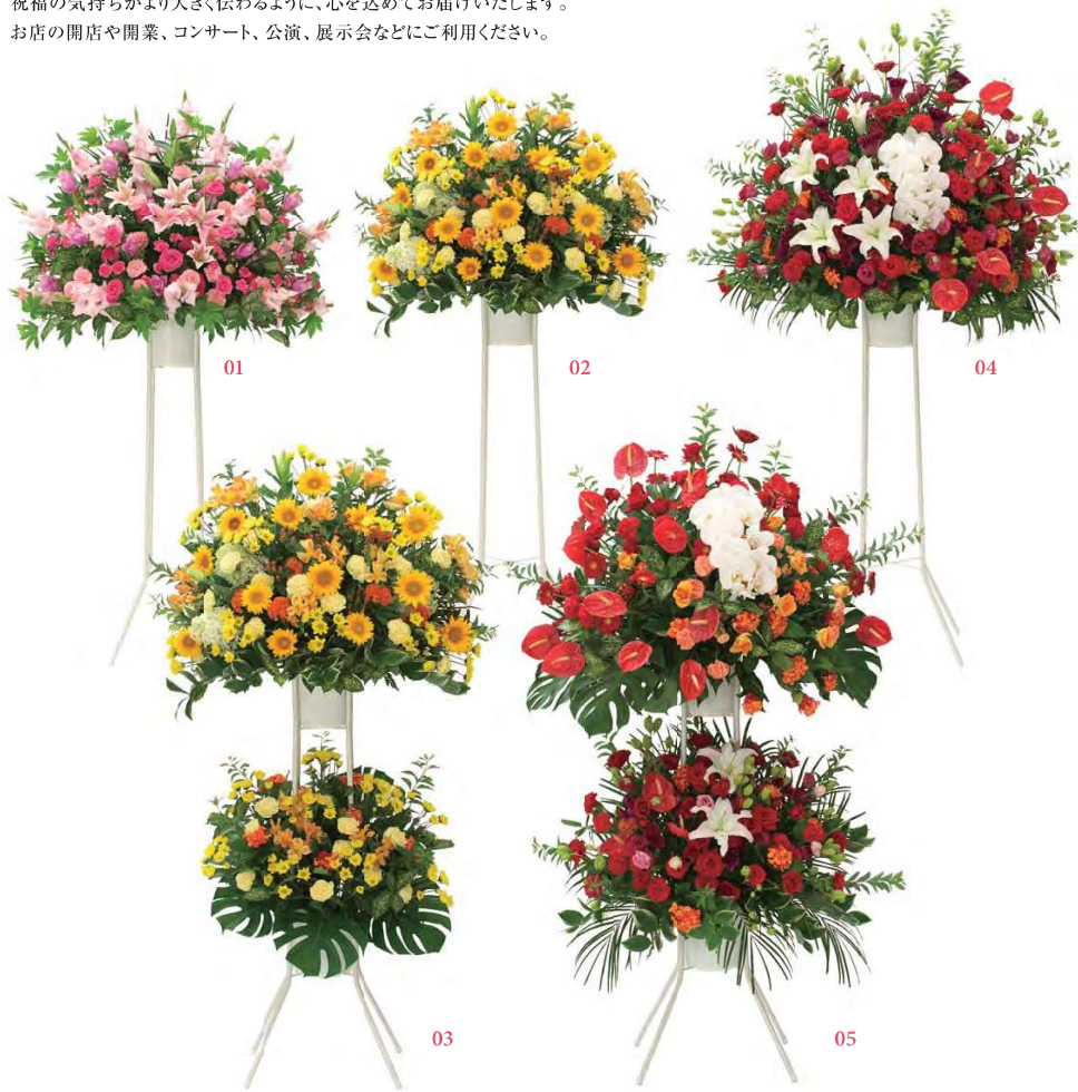
01 商品番号 SS150 スタンド花 (一段) 色 ピンク系 税別 ¥15,000 サイズ: 約 H180xW90cm

祝福の気持ちがより大きく伝わるように、心を込めてお届けいたします。 お店の開店や開業、コンサート、公演、展示会などにご利用ください。