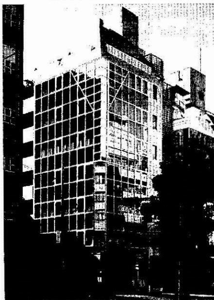
神田クリニック全景

* ライトコースは、既に検診や人間ドックを受診された方などに、MRI検査を気軽に受けられるようにしたものです。