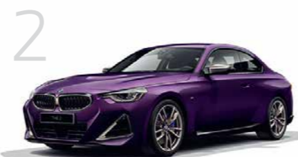
2 New M240i xDrive クーペ 8速スポーツAT 2ドア右ハンドル 7,580,000円 ニュー2シリーズ クーペは5,080,000円から