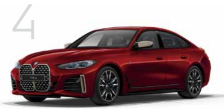
4 M440i xDrive グラン クーペ 8速スポーツAT 4ドア右ハンドル 10,060,000円 4シリーズ グランクーペは6,740,000円から