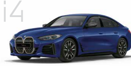
i4 New i4 M50 4ドア右ハンドル 10,810,000円 ニューi4は7,910,000円から