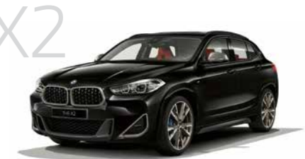
X2 X2 M35i 8速スポーツAT 5ドア右ハンドル 7,280,000円 X2は5,180,000円から