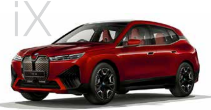
iX iX xDrive50 5ドア右ハンドル 12,850,000円 iXは10,750,000円から