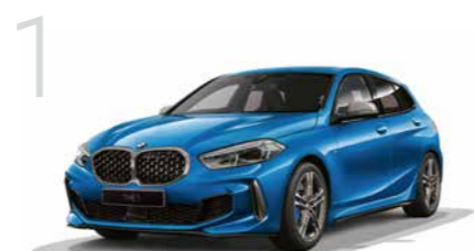
1 M135i xDrive 8速スポーツAT 5ドア右ハンドル 6,670,000円 1シリーズは4,460,000円から