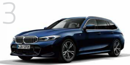
3 New 320d xDrive ツーリング M Sport 8速スポーツAT 5ドア右ハンドル 7,150,000円 ニュー3シリーズ ツーリングは6,270,000円から