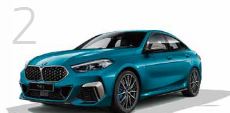
2 M235i xDrive グラン クーペ 8速スポーツAT 4ドア右ハンドル 6,920,000円 2シリーズ グランクーペは4,700,000円から