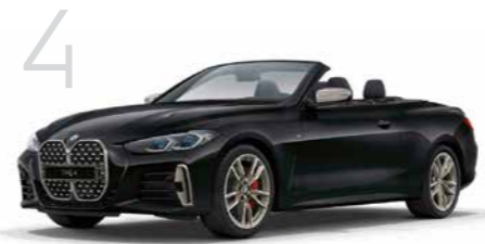
4 M440i xDrive カブリオレ 8速スポーツAT 2ドア右ハンドル 11,120,000円 4シリーズ カブリオレは7,260,000円から