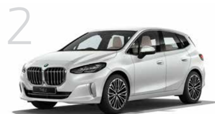
2 New 218i アクティブ ツアラー Exclusive 7速DCT 5ドア右ハンドル 4,470,000円 ニュー2シリーズ アクティブ ツアラーは4,470,000円から