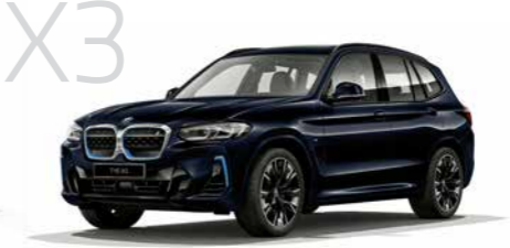
iX3 iX3 M Sport 5ドア右ハンドル 8,620,000円 iX3は8,620,000円から