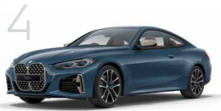
4 M440i xDrive クーペ 8速スポーツAT 2ドア右ハンドル 10,600,000円 4シリーズ クーペは6,670,000円から