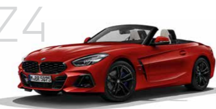
Z4 New Z4 sDrive20i M Sport 8速スポーツAT 2ドア右ハンドル 7,140,000円 ニューZ4は7,140,000円から