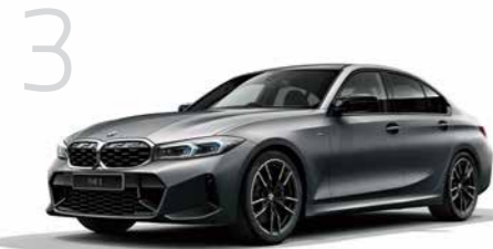
3 New M340i xDrive 8速スポーツAT 4ドア右ハンドル 10,400,000円 ニュー3シリーズ セダンは5,480,000円から