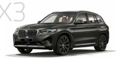
X3 X3 xDrive20i 8速AT 5ドア右ハンドル 7,210,000円 X3は7,210,000円から