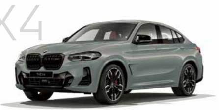
X4 X4 M40i 8速スポーツAT 5ドア右ハンドル 9,580,000円 X4は8,090,000円から