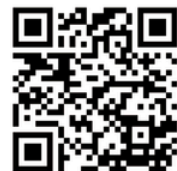
無料会員登録フォーム